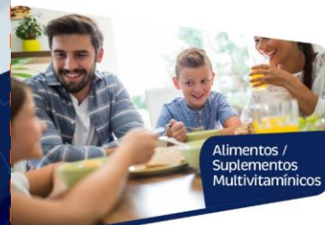
Alimentos / Suplementos Multivitamínicos