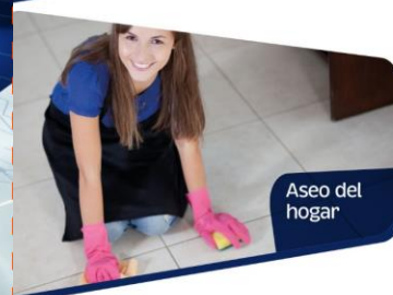
Aseo del hogar